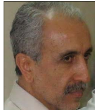
آقای مسعود رجوی، با سلام،

ابراهیم خدابنده ، عضو سابق سازمان مجاهدین خلق - ۲۳ آذر ۱۳۸۵ Ebrahim_Khodabandeh_2006@yahoo.com